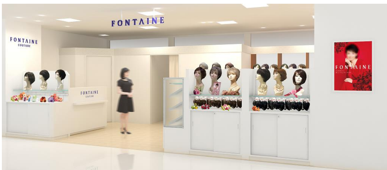
フォンテーヌ クチュール ラスカ小田原 (イメージ図)

女性用ウィッグブランド「フォンテーヌ」は、レディメイドウィッグ（既製品）を主力に、オーダーメイド・ウィッグから医療用ウィッグまで幅広く取り扱うフォンテーヌショップを全国の百貨店や直営店に展開しています（全国 188 店舗 2017 年 9 月現在）。ウィッグでよりおしゃれを楽しんでいただけるくつろぎの空間を提供し、おもてなしの心で全てのお客様をお迎えします。また、ウィッグの使い方や調整、メンテナンスはもちろんのこと、他社でウィッグを購入されたお客様のアフターメンテナンスサービスも実施しておりますので、ショッピングやお食事の合間にお気軽にお立ち寄りいただけます。