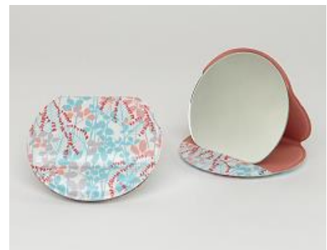
オリジナルコンパクトミラー