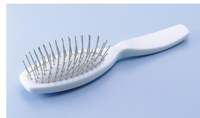
クッション金ブラシ