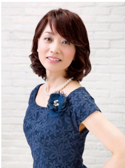
おしゃれセミナー講師

今回、「イオン太田店（リテールエリア）」は、エスカレーター増設など大規模なリニューアルが行われました。それに伴い当社店舗の「スワニーby フォンテーヌ イオン太田店」は、エレベーターから直結で店舗に入店できる、恵まれた立地条件に移転いたしました。また、従来より背の高い什器の設置が可能となったため、遠くからでもお客様に認識していただけます。たくさんの商品を陳列できるようになり、より多数の商品の中からお客様の好みに合わせたスタイルをご提案できるようになりました。「スワニーby フォンテーヌ イオン太田店」は、恵まれた立地条件を最大限に活かしながら、お客様に寄り添った丁寧な接客を行ってまいります。