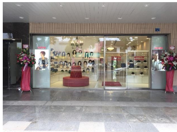
アデランス高雄店 (左：店舗外観、右：1階入口)