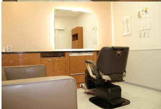
ご家族での来店を見越した広い待合スペース（上）と個室ブース（下）