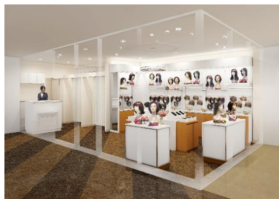
ショッブエリア（イメージ図）