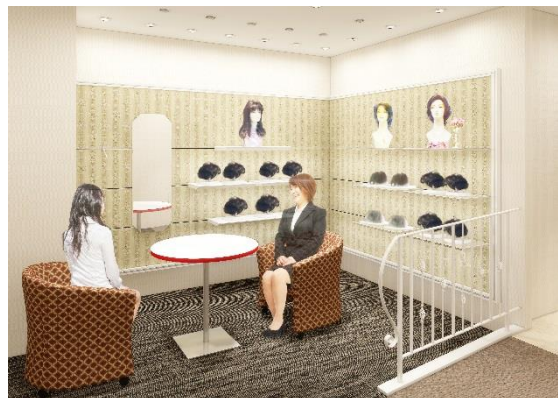
スタイル・ミュージアム（イメージ図）