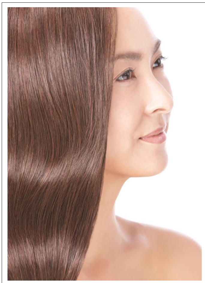
「ルイ ティアラ」ウィッグ使用イメージ

近年、トレンドに敏感でファッションや美容への意識が高い 40～50 代の女性が注目されています。「ルイ ティアラ（LOUI TIARA）」は、いつまでも美しくあり続けたいと願う、おしゃれに敏感な同世代をターゲットにした新オーダーメイド・ウィッグです。様々なヘアスタイルに合わせて 6 パターンの毛材バリエーションをご用意。サラサラのストレートヘアや、立体感華やぐカールスタイル、しなやかなウェーブのロングヘアなど、自然なハリ・艶のある上質なヘアスタイルを実現します。