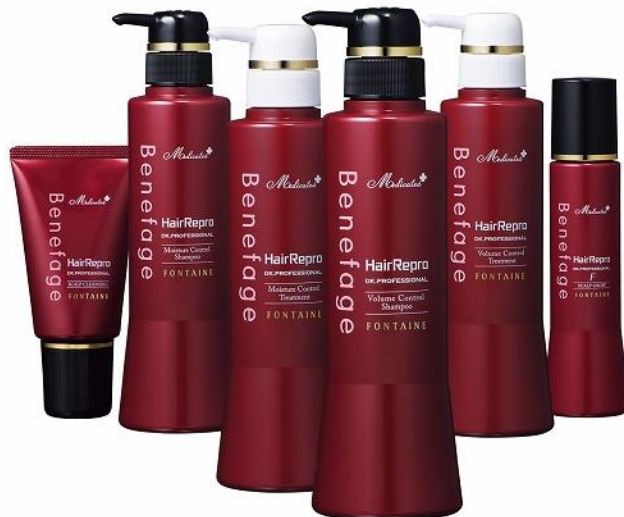
リニューアル新発売『Benefage HairRepro』シリーズ 写真は、リテール用（全6アイテム）

※ 1 小売業者向けの商品 ※ 2 アデランスのサロン向けの商品 ※ 3 頭皮（とうひ）＝スカルプより、スカルプの日 ※ 4 シリコン、着色料、香料、パラベン、サルフェート、鉱物油、フェノキシエタノールを使用しない7つのフリー