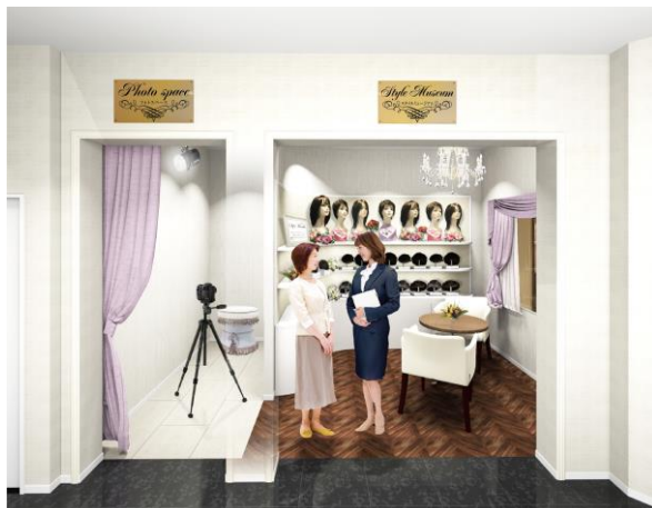
「アデランス川口」（イメージ図）

アデランスでは、近年ウィッグをファッションとして楽しむ女性が増加しているのを背景に、さまざまな髪型をお楽しみいただける「スタイル・ミュージアム」の導入店舗を拡大しております。今回「アデランス川口」が入居する「かわぐちキャスティ」は、3 階エントランス部分が JR 川口駅東口からペDESTリアンデッキで直結しているため、電車をご利用される方にもアクセスが非常に便利です。