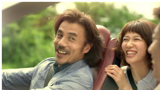
新 TV-CM「攻める男 スポーツ」篇