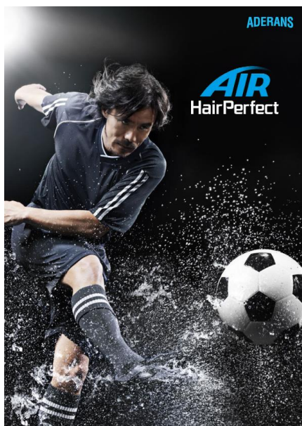
『ヘアパーフェクト エア』リーフレット

今回新たに開発した『ヘアパーフェクト エア』は、プライベートに仕事に奔走するアクティブな男性をターゲットにした増毛商品です。他のヘアパーフェクトシリーズの商品に比べて目が大きい格子状の「エスペースネット」をベース部分に新たに採用し、限りなく地肌感覚に近い優れた通気性を実現。発汗による頭皮のムレを気にすることなく、スポーツ時はもちろん夏の暑い時期を快適にお過ごしいただけます。また、従来の商品ではベース部分の網糸に髪 of 毛を締め付けて植毛していたところを、ループ状にして締め付けずに植毛する新技術「ループフリー」を採用し、身体の動きに応じた髪 of 自然な動きを再現しました。