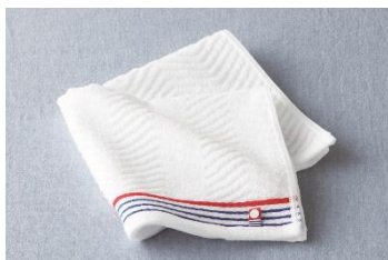
今治 あやなみハンドタオル(男性向け)

※今治 あやなみハンドタオル（男性向け）、今治 バタフライローズハンドタオル（女性向け）各 100 名様