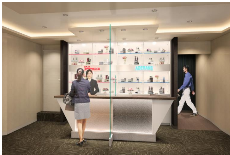
「アデランスいわき」（イメージ図）

「カウンセリングルーム」には大型モニターを設置し、ヘアチェックで頭皮状態をご確認いただけます。また、本格的な撮影機材を装備した「フォトスペース」も導入し、毛髪診断士がお客様の髪の悩みやご希望のヘアスタイルを丁寧にお伺いしながら、様々な商品をお試しいただけます。また、ウィッグを試着されたお姿を一眼レフカメラにて撮影し、写真をお持ち帰りいただくこともできます。