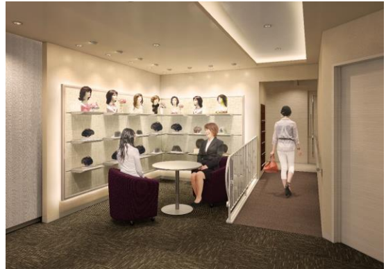
スタイル・ミュージアム（イメージ）

いわき駅は浜通り地方から中通り地方・宮城県・茨城県の三方を結ぶ拠点駅であり、常磐線と磐越東線の2路線が乗り入れています。また、いわき市の中心駅であり、福島県内で最大の人口及び面積を持ち、中核市に指定されています。2010年より新バスターミナルを併用開始したことで、連日バス利用者で賑わう場所でもあります。このような恵まれた立地条件を生かしながら、地域の方々に安心してご利用いただける、親しみやすく丁寧なサービスを行なってまいります。