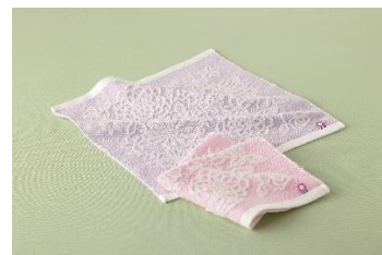
今治 バタフライローズハンドタオル(女性向け)