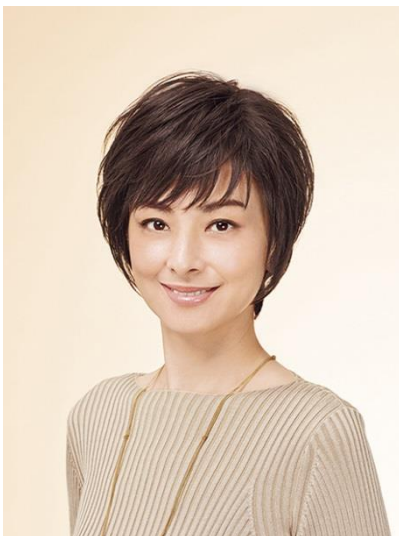
ナチュラルショート・スタイル (LH6)

年代を問わず人気の高い「ナチュラルショート・スタイル」と「ナチュラルボブ・スタイル」の2つのスタイルに、LF3（栗色）、LF4（栗色）、LH6（黄味のある栗色）の3色で展開致します。