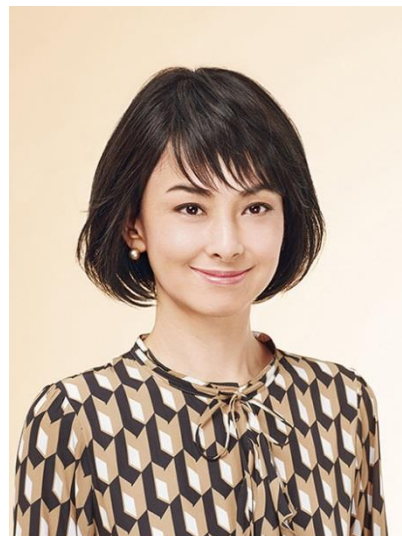
ナチュラルボブ・スタイル (LF4)