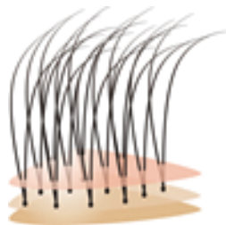
「ダブルアップ」構造のしくみ

ネットの表面に薄いベールを重ねることで結び目を見えなくした「ダブルアップ」構造により、髪の根元が自然に見えて、ふんわり立ち上がります。下のネットに毛を結び、ベールの上から毛を引き抜いており、結び目が見えないだけでなく、毛が抜けにくいのが特徴です。髪をどこからかきわけても、頭皮のようなナチュラルさを実現しました。