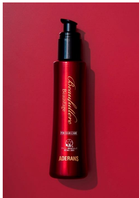
「ビューステージ ビューフラーレ」

※ 4 香料、着色料、パラベン、鉱物油、アルコール、石油系界面活性剤、合成酸化防止剤、紫外線吸収剤不使用