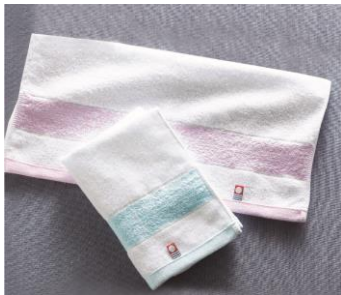
今治 エターナルハンドタオル(女性向け)