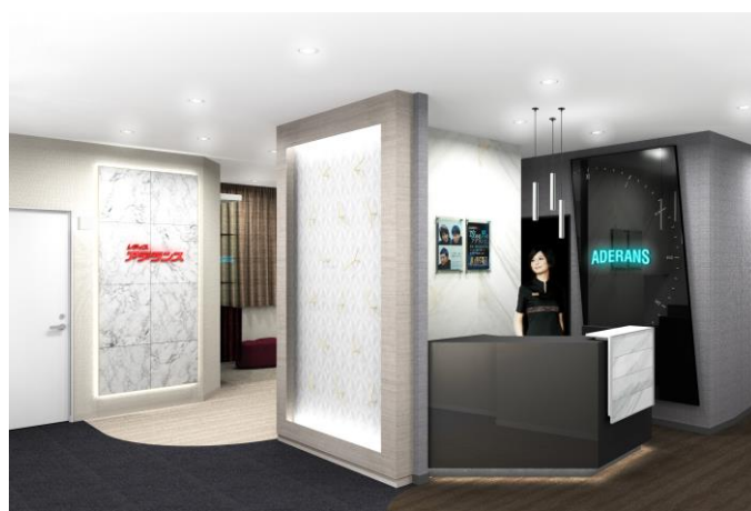
「アデランス明石」（イメージ図）