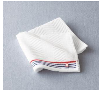
今治 あやなみハンドタオル(男性向け)