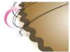
飾り植えイメージ