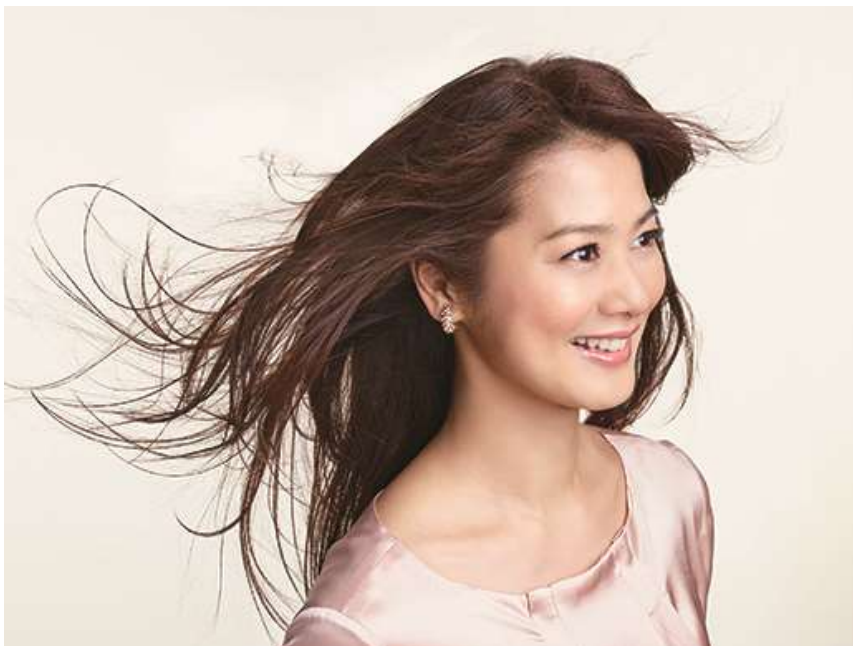
「ルイティアラボーテ」ウィッグ使用イメージ

「ルイティアラボーテ」は、トレンドに敏感でファッションや美容への意識が高い 40～60 代の女性をターゲットにした商品です。ベース本体を波形にした「なみなみフィット」に加え、前髪部分には地肌に溶け込み境目が気にならない「ふんわりフロント」を当社として初めて採用し、360 度どこから見ても自髪のような仕上がりを実現しました。ベースに、ネット目が大きく通気性に優れた「パールネット」を新採用しており、1 年を通して快適に愛用いただけます。毛材は、あらゆる髪色に合わせられるよう、昨年 1 月から販売しているルイティアラで使用している従来カラー 141 色（自由にブレンド可能）に、今回新たに「ルイブレンドカラー」全 30 色を追加しました。明るい色から暗い色まで 3～9 色を混ぜ合わせたルイブレンドカラーで、ヘアスタイルに美しい立体感を持たせ、お客様の理想のヘアスタイルと髪色を実現します。毛材にはふわっと軽いヘアスタイルに仕上がる特徴の違う 2 種類の人工毛髪をブレンドしています。