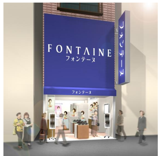
「フォンテーヌ巣鴨地蔵通り」 （イメージ図）