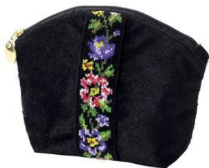
お買い上げプレゼント 「コスメポーチ」