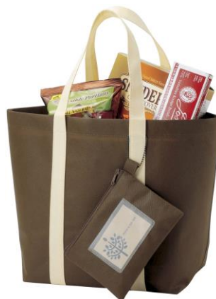
ご試着プレゼント 「ポーチ&エコトート」 ※中身は入っていません