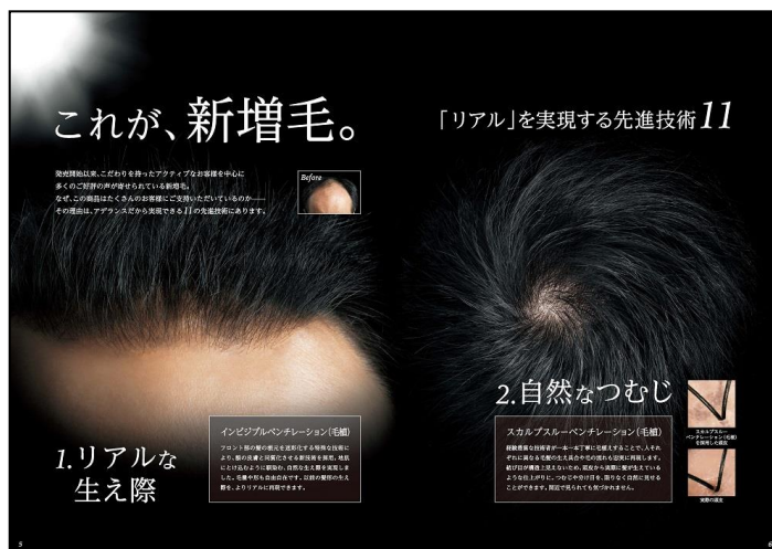
『増毛ブック(ZOMO BOOK)』表紙(左)、中面(右)