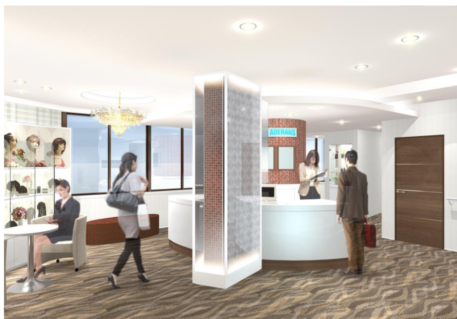
「アデランス久留米」 左：女性サロン「レディスアデランス」入口、右：男性サロン「アデランス」入口 (イメージ図)

リニューアルした新しい店舗は、白とブラウンを基調とした落ち着いた雰囲気的空間で、ガラスやタイルを用いたスタイリッシュな作りです。男性サロン、女性サロン共に専用のエントランスと個室ブースを完備しており、お客様のプライバシーにも十分配慮した作りとなっています。また、女性サロンには近年ウィッグをファッションとして楽しむ女性が増加しているのを背景に、ロングヘアやショートヘアなど様々なスタイルのウィッグを多数展示する「スタイル・ミュージアム」と、本格的な撮影機材を装備した「フォトスペース」を新たに導入しています。沖縄県を除くと九州では熊本県に続き 2 店舗目となる「スタイル・ミュージアム」導入店舗です。さまざまな商品をお試し頂きながら、専門のヘアスタイリストがお客様の魅力を引き出すウィッグ選びをお手伝いします。