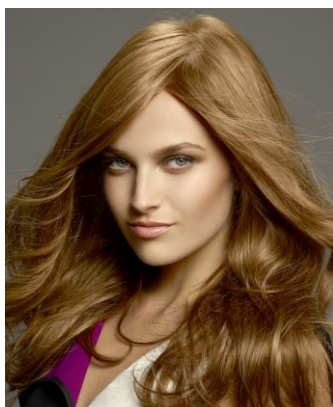
品番:A1139 (プレタポルテ) 価格:280,000円+税