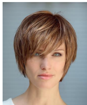
品番:A1088 (プレタポルテ) 価格:120,000円+税