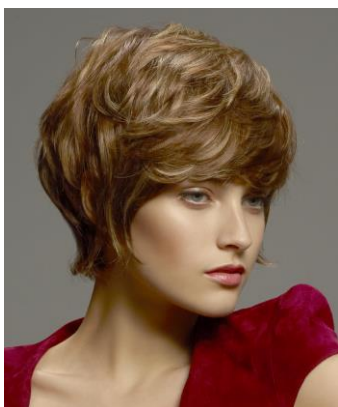
品番:A1136 (プレタポルテ) 価格:250,000円+税