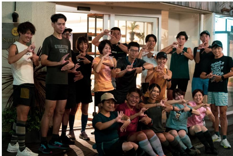
ショールーム前で Sockwell の「S」ポーズを

各ポイントで記念撮影を楽しんだり、初対面のランナー同士がお互いに声を掛け合い、和やかな雰囲気と一緒に走りました。ゴールまでの間、全員で楽しいひとときを過ごすことができました。