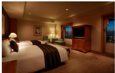
ホテル アゴラ リージェンシー 大阪堺