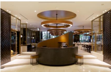
ホテル アゴラ 大阪守口