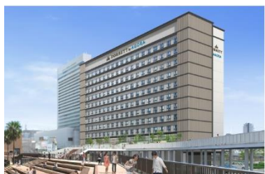
ドーセット バイ アゴラ 大阪堺 (2025年3月25日開業)