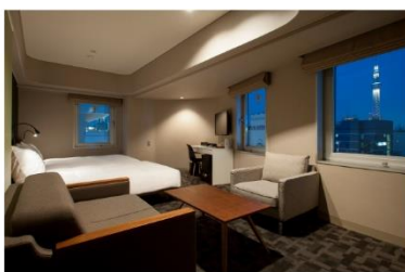
アゴラブレイス 東京浅草