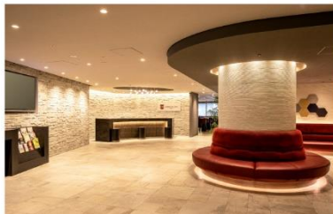
アゴラブレイス 大阪難波