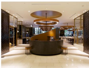
ホテル アゴラ 大阪守口