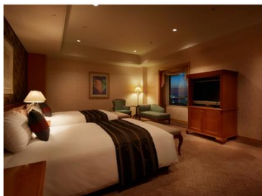
ホテル アゴラ リージェンシー 大阪堺