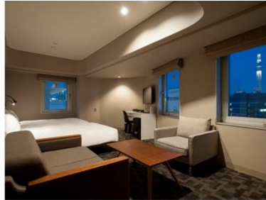
アゴラプレイス 東京浅草