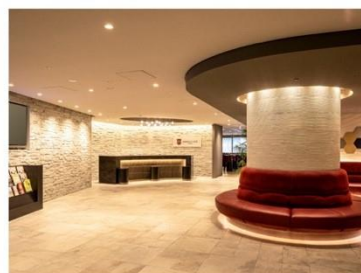
アゴーラプレイス 大阪難波