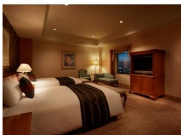
ホテル アゴーラ リージェンシー 大阪堺