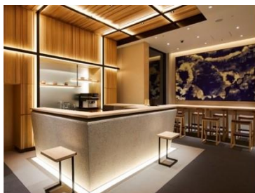
アゴーラ 東京銀座

アゴーラ ホスピタリティーズは、「美しい日本を集めたホテルアライアンス」をビジョンに掲げ、お客様の期待を超える最高の場所を提供するとともに、地域に貢献できる「街の自慢」となるホテルの創出を目指します。全国で9施設、客室数1,283室を展開。