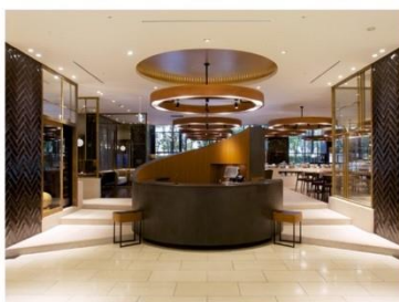
ホテル アゴーラ 大阪守口