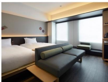
アゴーラ 京都四条