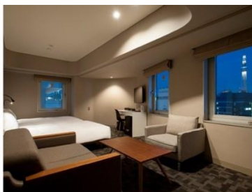
アゴーラプレイス 東京浅草