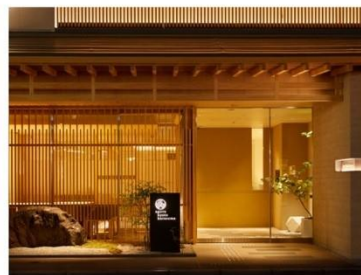
アゴーラ 京都烏丸