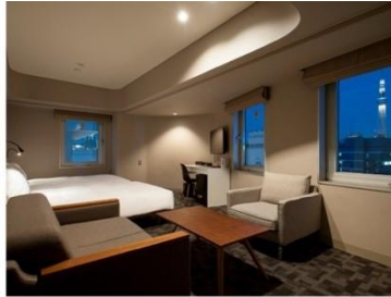
アゴラプレイス 東京浅草