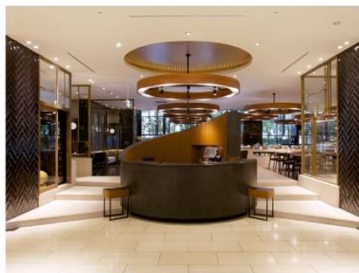
ホテル アゴラ 大阪守口