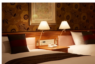
ホテル アゴーラ リージンシー 大阪堺