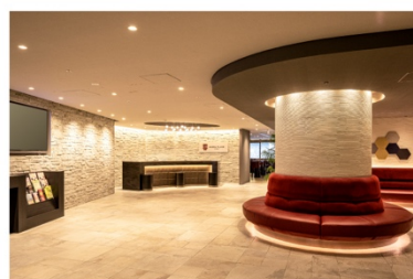
アゴーラプレイス 大阪難波