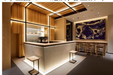
アゴーラ 東京銀座

アゴーラ ホスピタリティーズは、「美しい日本を集めたホテルアライアンス」をビジョンに掲げ、お客様の期待を超える最高の場所を提供するとともに、地域に貢献できる「街の自慢」となるホテル、旅館の創出を目指します。全国で10施設、客室数1,329室を展開。