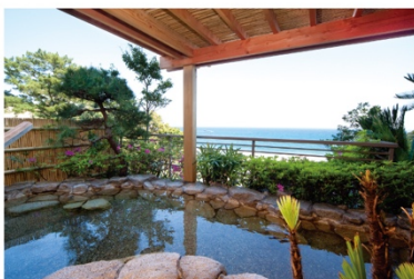
伊豆今井浜温泉 今井荘