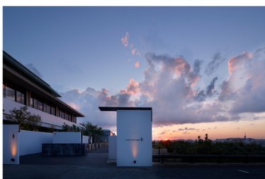
アゴラ福岡山の上ホテル&スパ