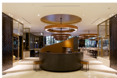
ホテル アゴラ 大阪守口