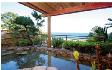
伊豆今井浜温泉 今井荘