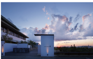
アゴラ福岡山の上ホテル&スパ