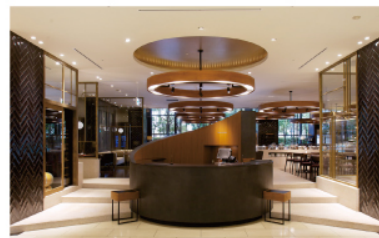
ホテル アゴラ 大阪守口