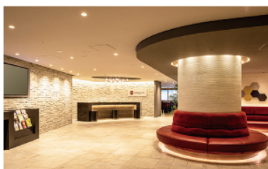
アゴラプレイス 大阪難波