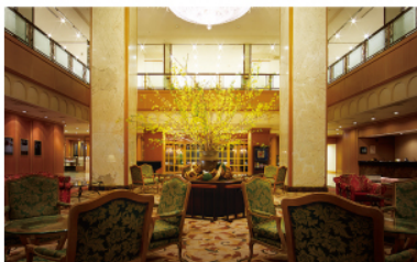
ホテル アゴラ リージェンシー 大阪堺