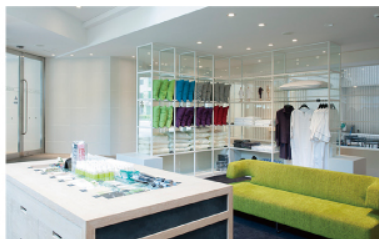
アゴラプレイス 東京浅草