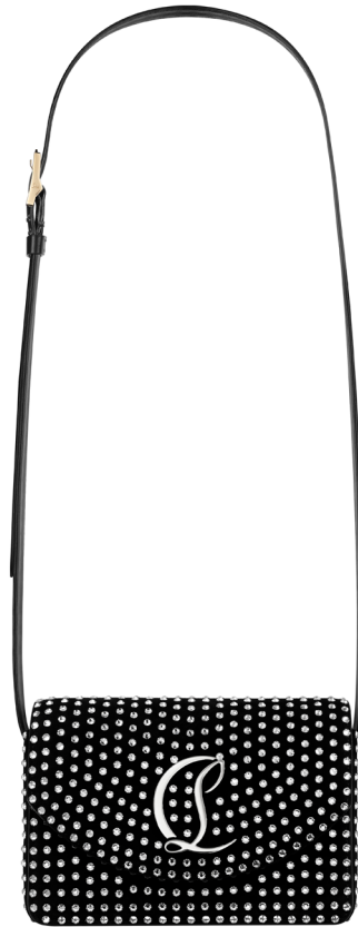
BOOM BOOM STRASS

くっきりとした印象のブルーとイエローのコンビネーションや、鮮やかなライラックとアイボリーホワイトをアイコンックなトーン・オン・トーンで組合せ、CLロゴのメタルパーツで華やかさを添えました。ストラスや、シャイニーなラミネート加工を施したインターレース(編み込み)レザーなど様々なディテールが魅力を放つ、クロスボディバッグLOUBI54は今後も年間を通じて新たな色や素材で展開していく予定です。