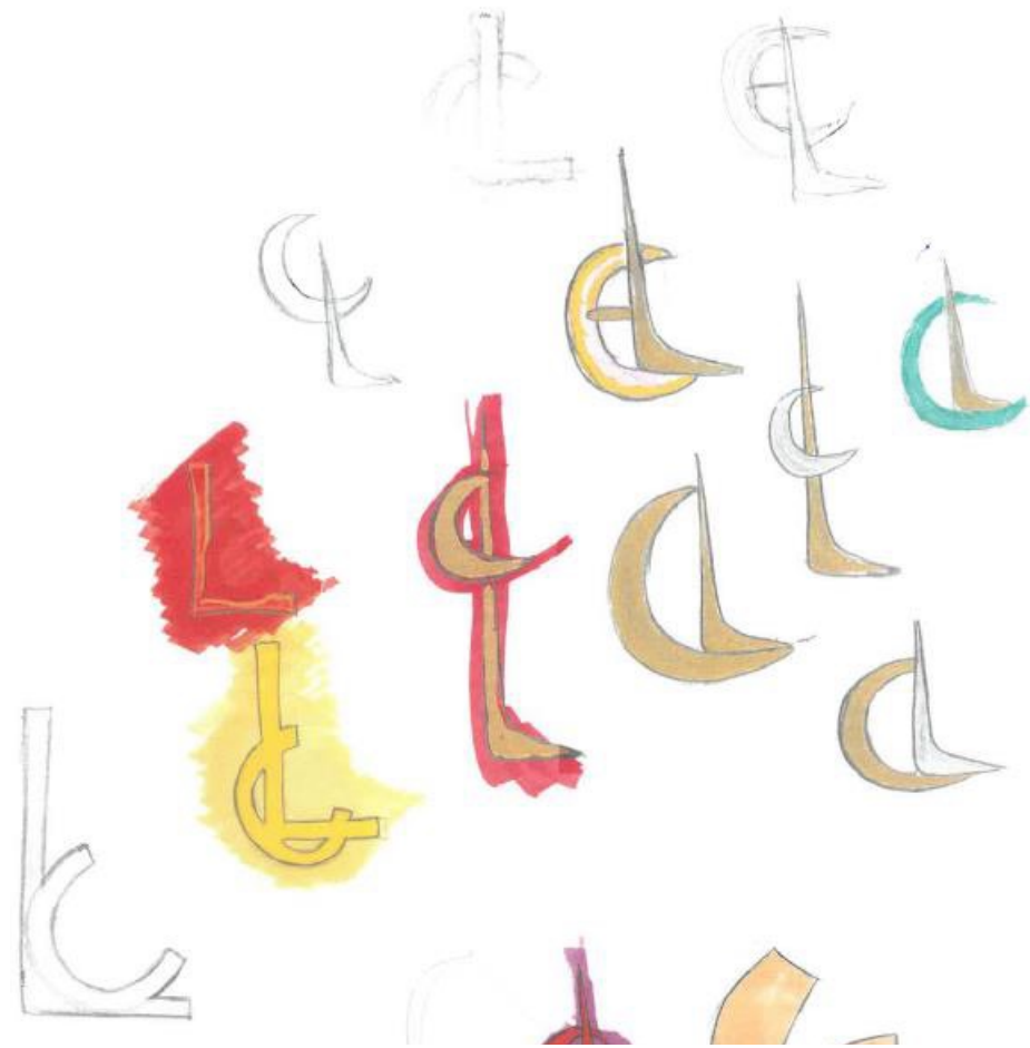
Logo design sketches, circa 2010

「Studio54」からインスパイアされ、元々はイブニング用のクラッチバッグとして発表された「LOUBI54」。1970年代に世界で最も有名なナイトクラブとして一世を風靡した「Studio54」は、自由、自己表現、ファッションの発信源でした。常連客で盛り上がるマンハッタンのナイトクラブのように、華やかな賑わいを見せるパリのナイトクラブシーンに欠かせない存在であり続けるクリスチャン・ルブタン。ヨーロッパのStudio54と言われる「Le Palace」のワイルドで刺激的な雰囲気の中に、クリスチャンはかなり若い頃から身を投じてきました。LOUBI54はそんな1970年代のクラブシーンへのオマージュでもあり、クリスチャン・ルブタン自身のナイトライフに対する愛を込めた作品でもあります。クリスチャン・ルブタンで最も認知度が高く人気シリーズの1つであるLOUBI54に相応しく、メゾンならではのディテールとシンボルで仕上げました。各バッグにエレガントな彩りを添える、CLムーンクレストが特徴です。CLロゴの文字が交差するようなデザインに、クリスチャン・ルブタンが「曲線(カーブ)の巨匠」と呼ぶ、ブラジルの建築家であり家具デザイナーでもあるオスカー・ニーマイヤーへのオマージュが薫ります。