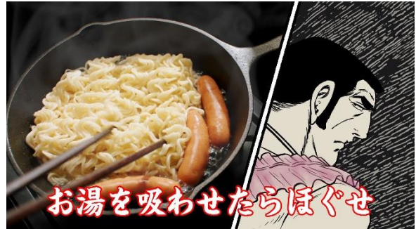
②中火で30秒で裏返し、お湯を吸わせたらほぐせ。