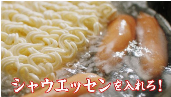
①220mlのお湯に日清焼そばとシャウエッセンを入れろ！

「ジューシーな肉汁とスパシーなソースの組み合わせが間違いない！」 簡単調理で空腹を満たす、画期的な“ハードボイルドウイナー焼そば”。 「日清焼そば」の通常の作り方に「シャウエッセン」を加えて一緒にゆでるだけのシンプルかつ大胆な調理方法で仕上げる、間違いないおいしさの焼そばです。 ニッポンハムグループ公式YouTubeチャンネルで紹介されている「シャウエッセン」のおすすめの調理法「時短ボイル」を応用した調理方法で、「日清焼そば」と「シャウエッセン」のどちらもおいしく仕上がります。 ( https://www.youtube.com/watch?v=lwEchoF9aWM )