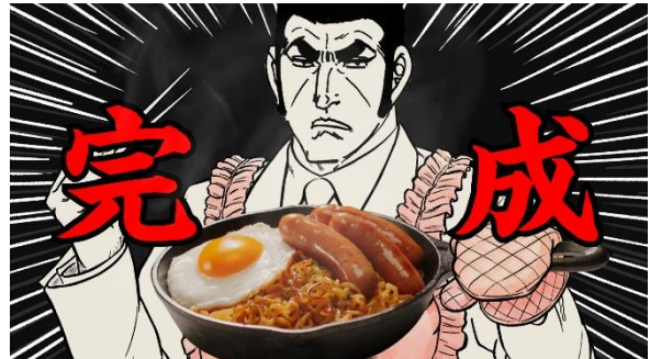
④チリチリと音がしたらお好みのトッピングをして、青のりをかけたら完成だ。