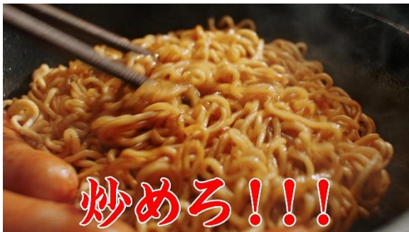
③水分がなくなる前にソースを加え、強火で炒めろ！！