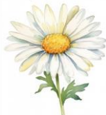
カモミール (カミツリ花エキス)