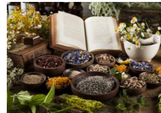
植物療法がより身近な、ヨーロッパのハーブ薬局を訪れたようなイメージ

ローズマリーやラベンダーを基調とした、 リラクシーなハーバルフローラル調の香り に包まれて。日常から解き放たれる、至福のケアタイムをお過ごしいただけます。