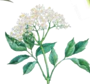
エルダーフラワー (セイヨウニワトコ花エキス)