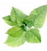
ペパーミント (セイヨウハッカ葉エキス)