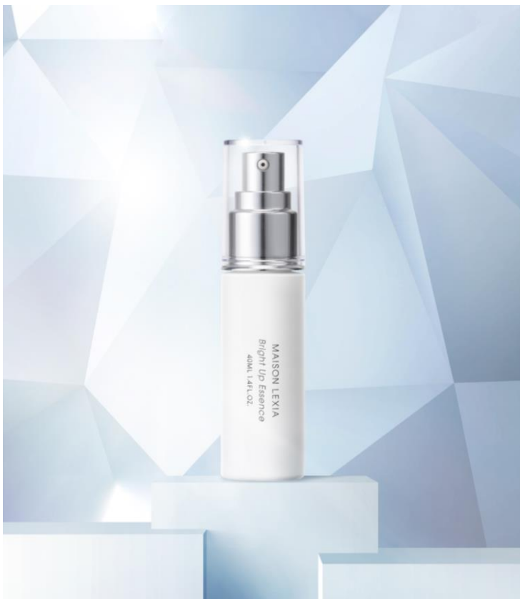
[ブライトニング美容液] メゾンレクシア ブライト アップ エッセンス 40mL 8,800円（税込）

植物が部位ごとに秘める力を緻密に組む独自処方で肌本来の美しさを追求するメゾンレクシアは、2024年2月1日（木）、ブライトニング ※2 美容液「メゾンレクシア ブライト アップ エッセンス」を新発売します。