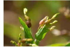
貴重な国産有機ハトムギエキスを発酵させた美容成分