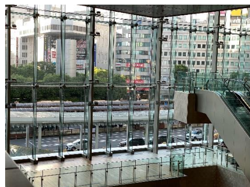
JR 横浜タワー2F アトリウム