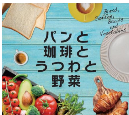
「パンと珈琲とうつわと野菜」キービジュアル

本イベントを通じて、多くの方々に YOKOHAMA Station City や神奈川・横浜の魅力を触れていただきたいと考えております。