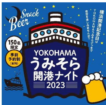
「YOKOHAMA うみそら開港ナイト」キービジュアル

本企画を通じ、多くのお客さまに YOKOHAMA Station City や横浜エリアの魅力に触れていただきたいと思います。