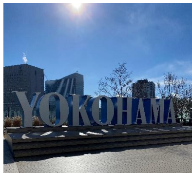
JR 横浜タワー12F 屋上広場 うみそらデッキ