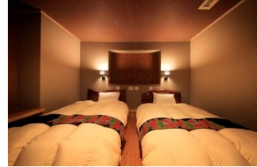
（特徴）客室専用の足湯がついています。 ※他にナシ広めのTypeB,3がございます。全図はお客様タイプはお探下さい。

◆価格(1泊2食付)：48,600円～(税込・入湯税別) ※1室2名様利用の場合の1名様料金