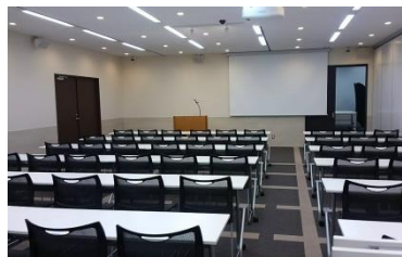
会議室内イメージ