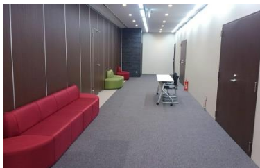
ホワイエ（休憩スペース）イメージ