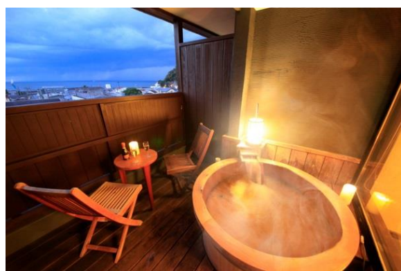
人気の温泉露天付き客室

昨年11月、囲炉裏を中心に～集う・語らう・食す～新しい感覚のIRORI(いろり)～をテーマにリニューアルオープンした旅館です。土肥というエリアにありながら平均稼働率約70%と高い稼働率を誇る人気の宿に成長することができました。今回、開業から沢山のお客様にお越しいただき、当施設を支えて頂いたことに感謝を込めた特別企画です。