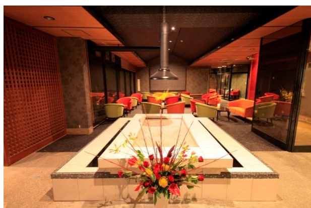
エントランスを彩る IRORI

~~~~~ 【祝開業1周年アニバーサリー】西伊豆の温泉旅館【ゆとりろ西伊豆】 【露天付き和室1泊2食付宿泊券】を2名1組様 約4万円相当プレゼント ~~~~~ ～お客様へ1周年の感謝の気持ちを込めて～ ~~~~~