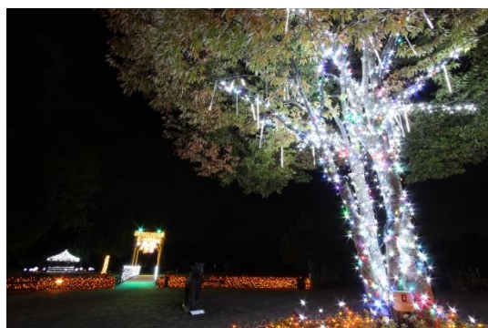
神秘の森への入り口

◆【お一人様最大 2,500 円 OFF*】開催記念宿泊プラン： http://directin.jp/?x=A2A3G3