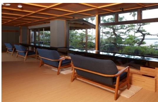
【ロビー併設の足湯】