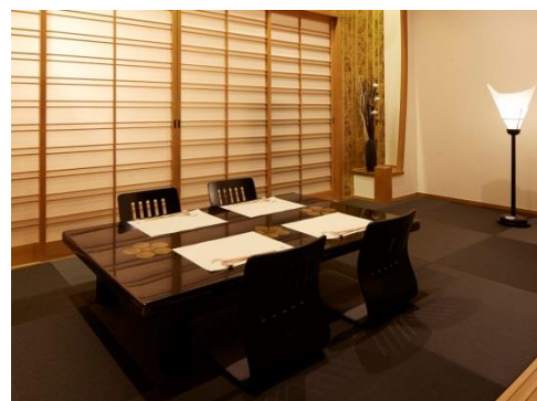
【プライベートな空間を大切に】