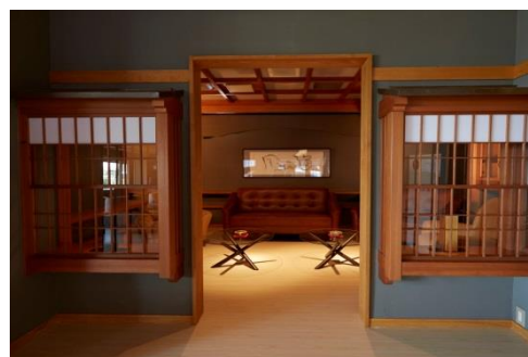
【喫煙スペースもお洒落に演出】