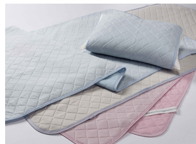
クールパッドシート/ピローパッド(CB8600)