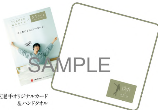
羽生結弦選手オリジナルカード &ハンドタオル