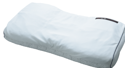
オーダーメイドピロー