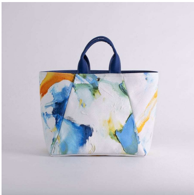
舟形トートバッグ | Decipher 202108 アーティスト : EnoR | KUMIKO TAMURA 14,960円 (税込 16,456円)