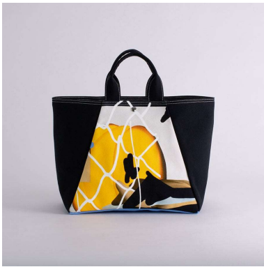
舟形トートバッグ | iPadで描く アーティスト：山崎由紀子 16,320円（税込 17,952円）