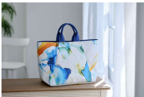
▲インテリアとして