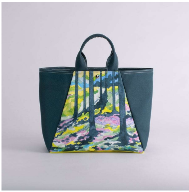
舟形トートバッグ | ゆらり アーティスト : Futaba. 15,640円 (税込 17,204円)