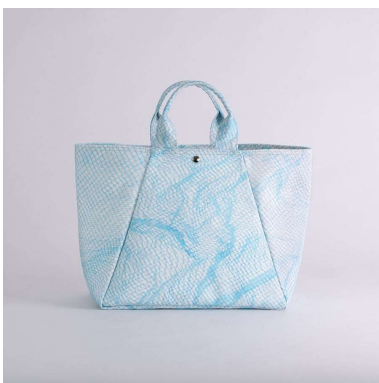
舟形トートバッグ | blue net アーティスト：金本凜太郎 15,640円（税込 17,204円）