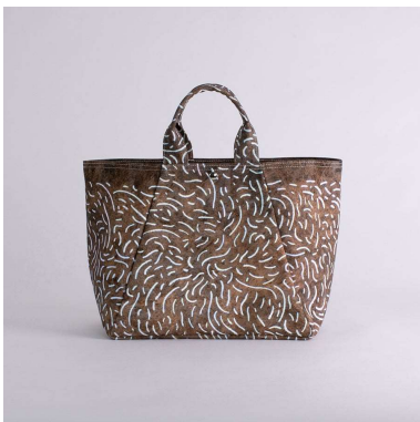
舟形トートバッグ | 毛むくじゃら アーティスト : 高橋梓 16,320円 (税込 17,952円)