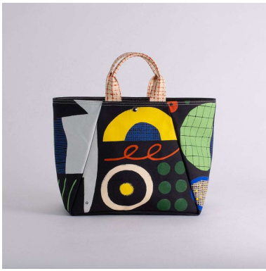
舟形トートバッグ | とりとくだもの アーティスト：しまむらひかり 価格：16,320円（税込 17,952円）