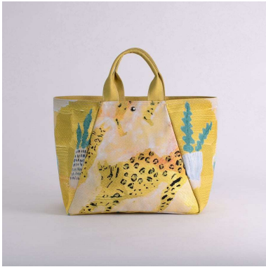
舟形トートバッグ | いたずらふわふわ アーティスト : 高田昌耶 14,960円 (税込 16,456円)