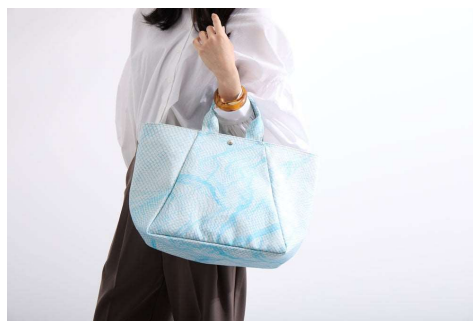
▲ファッションとして