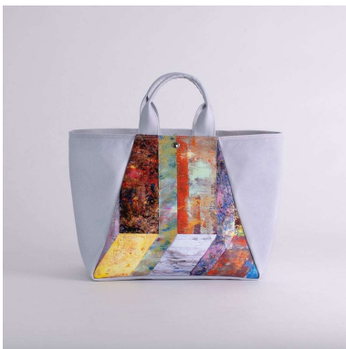
舟形トートバッグ | Gesture 2 アーティスト：片山高志 15,640円（税込 17,204円）