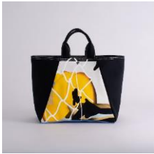
舟形トートバッグ | iPad で描く アーティスト：山崎由紀子 16,320 円 (税込 17,952 円)