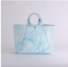
舟形トートバッグ | blue net アーティスト：金本凜太郎 15,640 円 (税込 17,204 円)