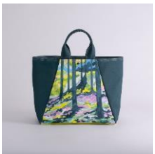
舟形トートバッグ | ゆらり アーティスト：Futaba. 15,640 円 (税込 17,204 円)