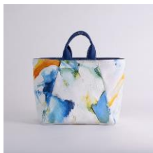
舟形トートバッグ | Decipher 202108 アーティスト：EnoR | KUMIKO TAMURA 14,960 円 (税込 16,456 円)