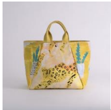
舟形トートバッグ | いたずらふわふわ アーティスト：高田昌耶 14,960 円 (税込 16,456 円)