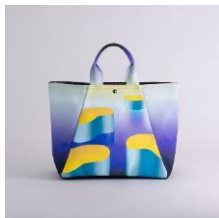
舟形トートバッグ | 耳が鳴るほど静かに アーティスト：millitsuka 16,320 円 (税込 17,952 円)