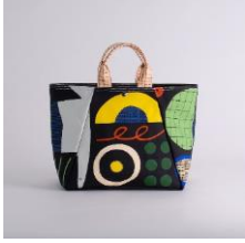
舟形トートバッグ | とりとくだもの アーティスト：しまむらひかり 価格：16,320 円 (税込 17,952 円)