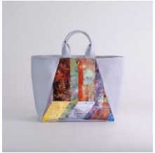
舟形トートバッグ | Gesture 2 アーティスト：片山高志 15,640 円 (税込 17,204 円)