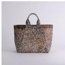
舟形トートバッグ | 毛むくじゃら アーティスト：高橋梓 16,320 円 (税込 17,952 円)