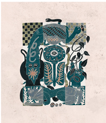
deep in the forest