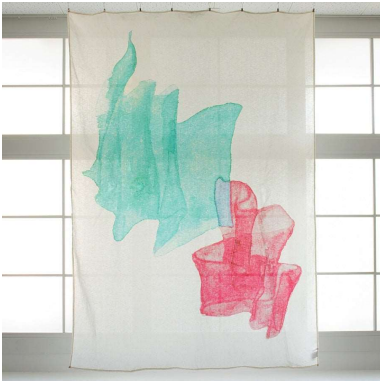
2.リネンマルチクロス | ホント、ホント、ウソ