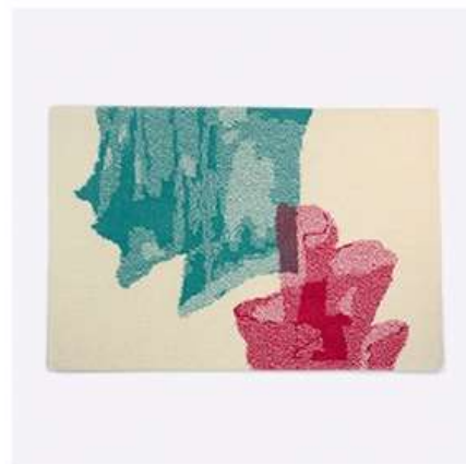
ウールラグ | オーロラ (高橋生也)