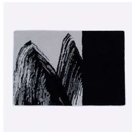
ウールラグ | with ink 1 (chappy-石部奈々美)