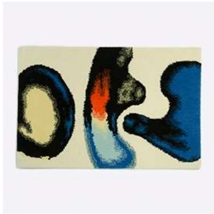
ウールラグ | 作品1 (ヒロセリョウジ)