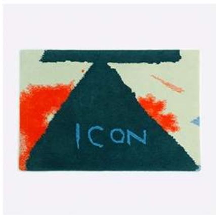
ウールラグ | ICON (千野六久)