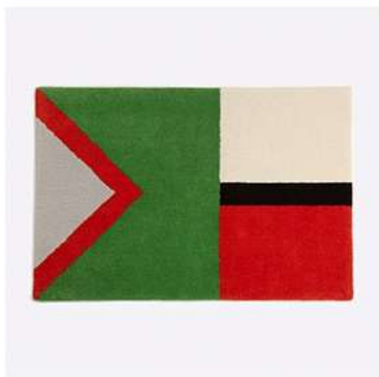
ウールラグ | Pattern (前田裕)