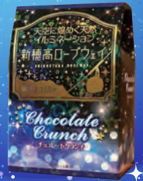
チョコレートクランチ 540円(税込)