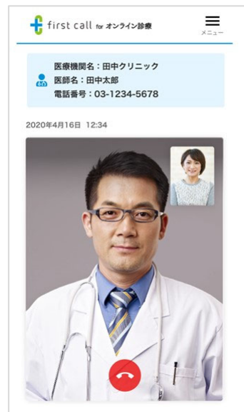
患者側の画面イメージ