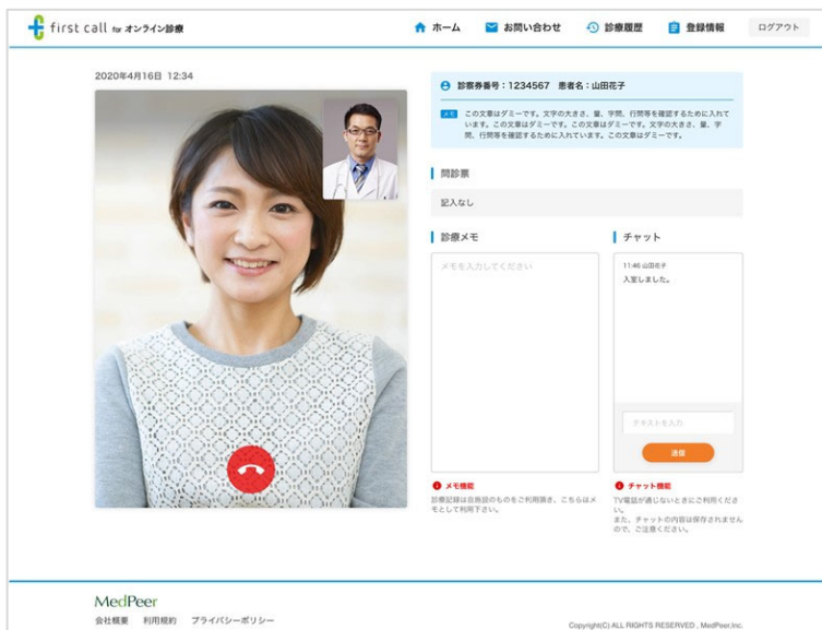
医師側の画面イメージ