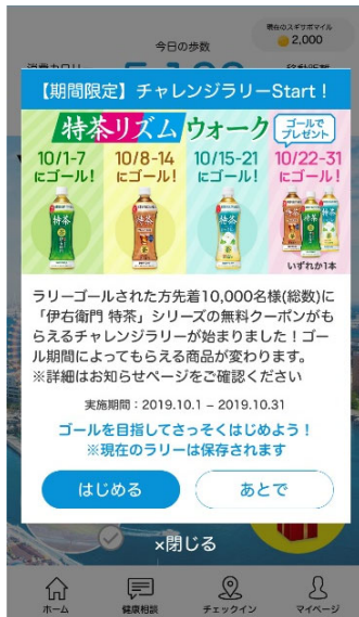
1.期間中にチャレンジラリーの案内画面が表示