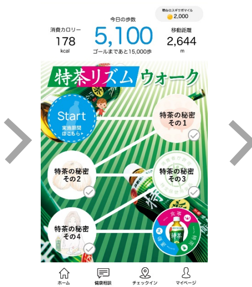
2.チャレンジラリーに参加して、ゴールを目指そう！